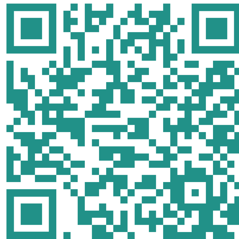
Ютуб -канал «Genetico Invest»