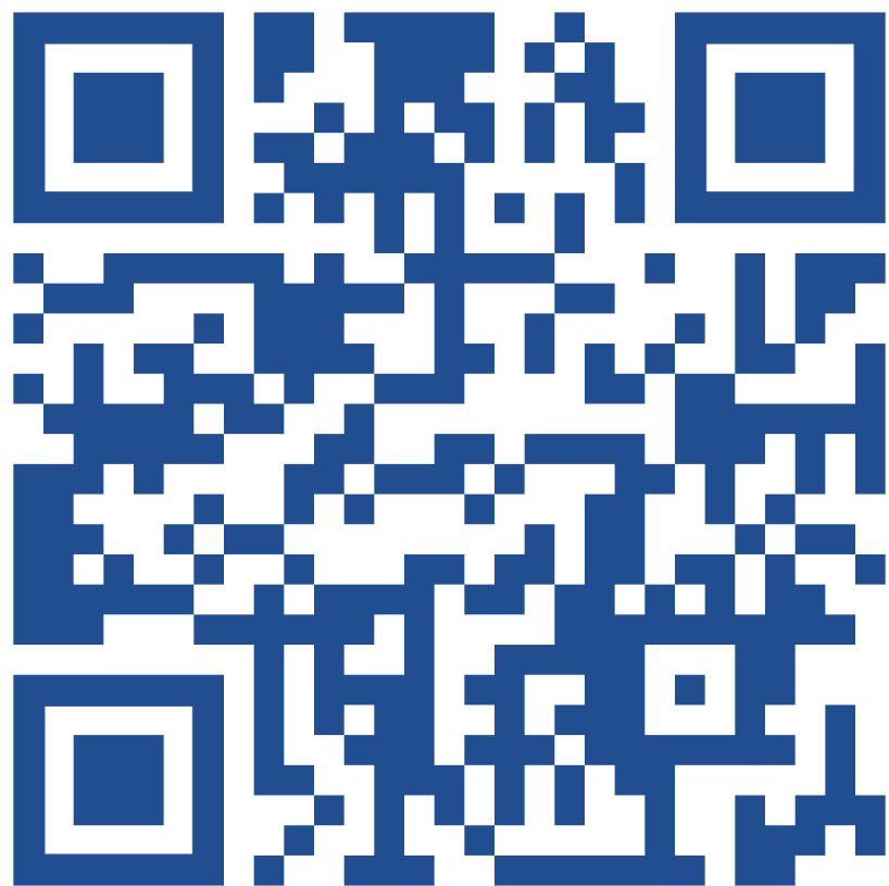
Телеграм-канал «Genetico Invest»